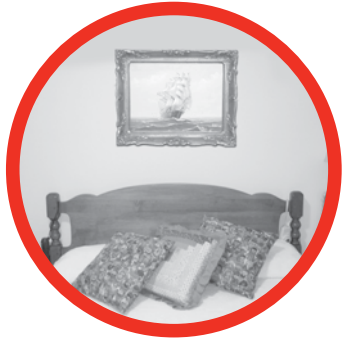
កុំដាក់កញ្ចប់រូបថត និង កញ្ចប់ភ្លុះមុខ នៅលើក្បាលដំណេក ឱ្យសោះ។